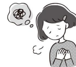
悩んでいる ことがあるとき